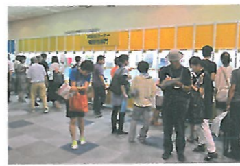
各社の出展内容は文紙 MESSE ホームページでご覧下さい。